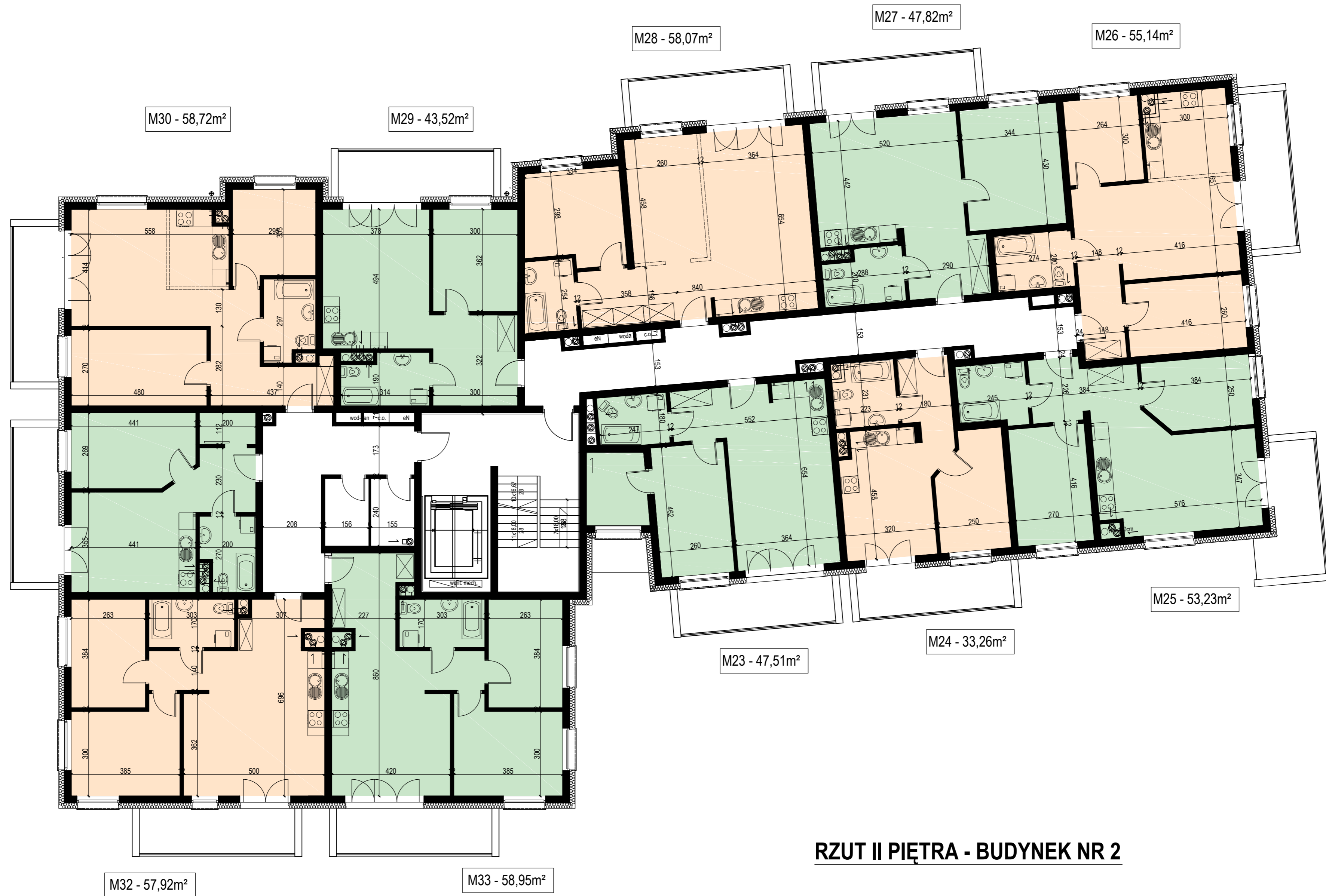
RZUT II PIĘTRA - BUDYNEK NR 2