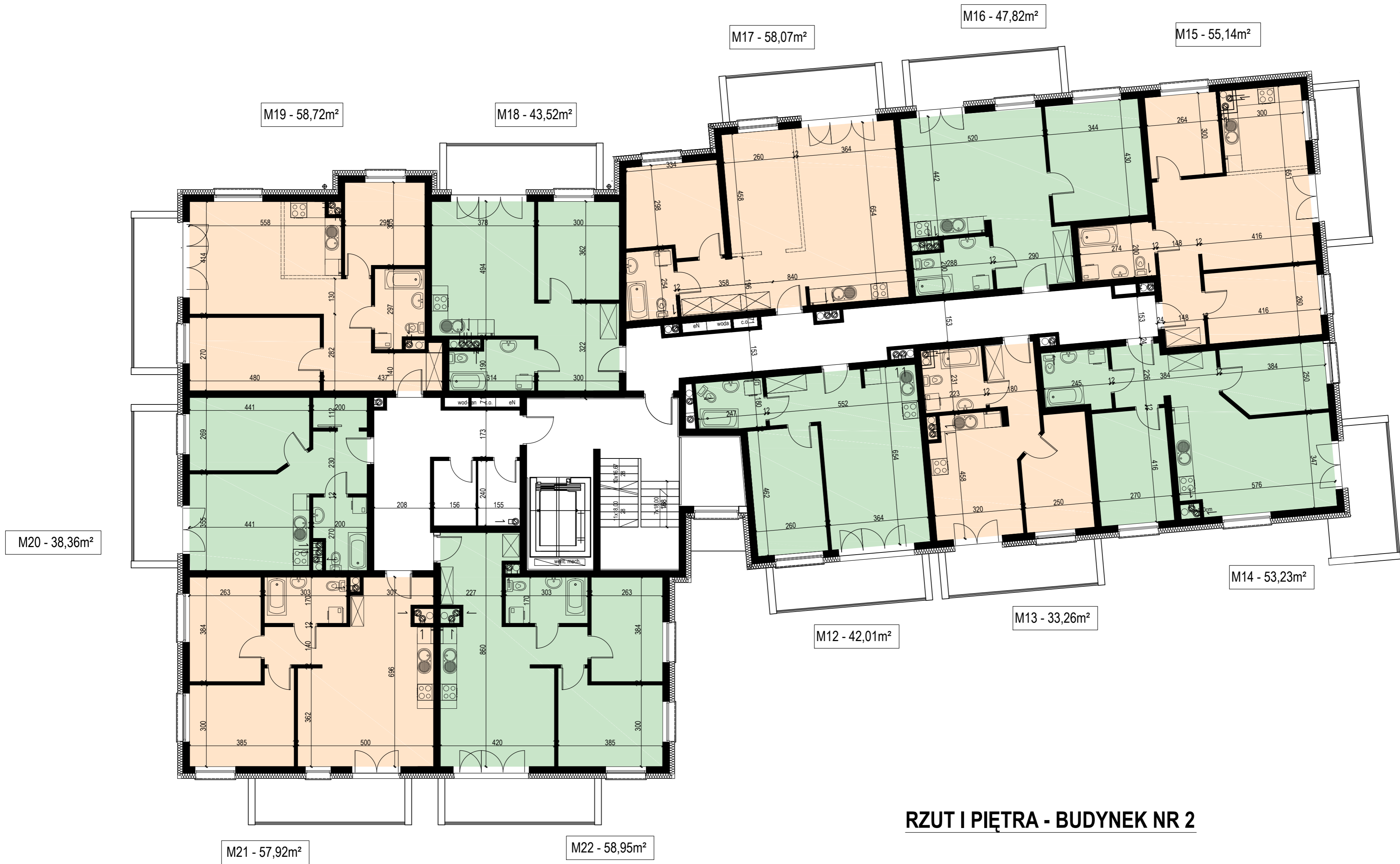
RZUT I PIĘTRA - BUDYNEK NR 2