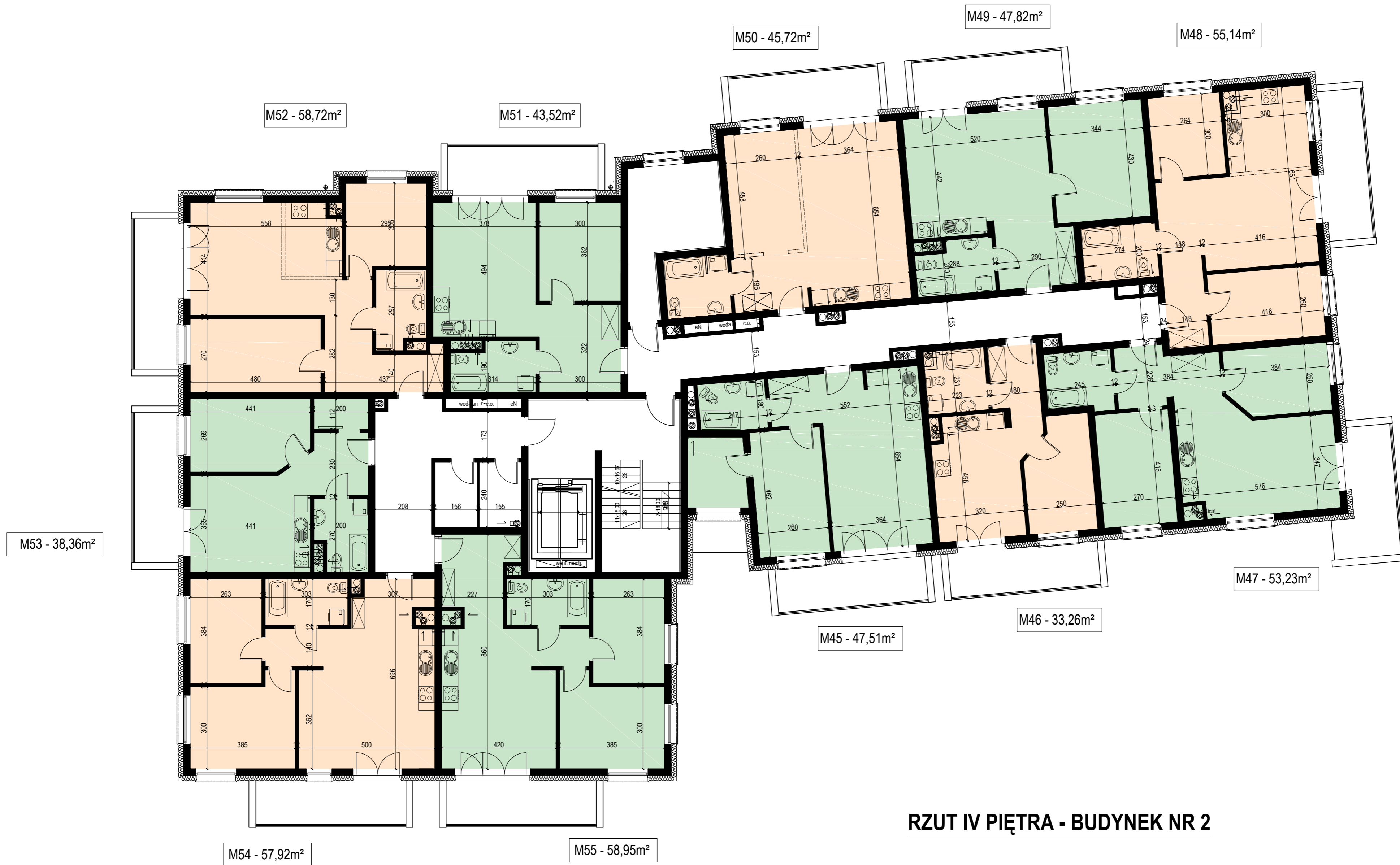
RZUT IV PIĘTRA - BUDYNEK NR 2