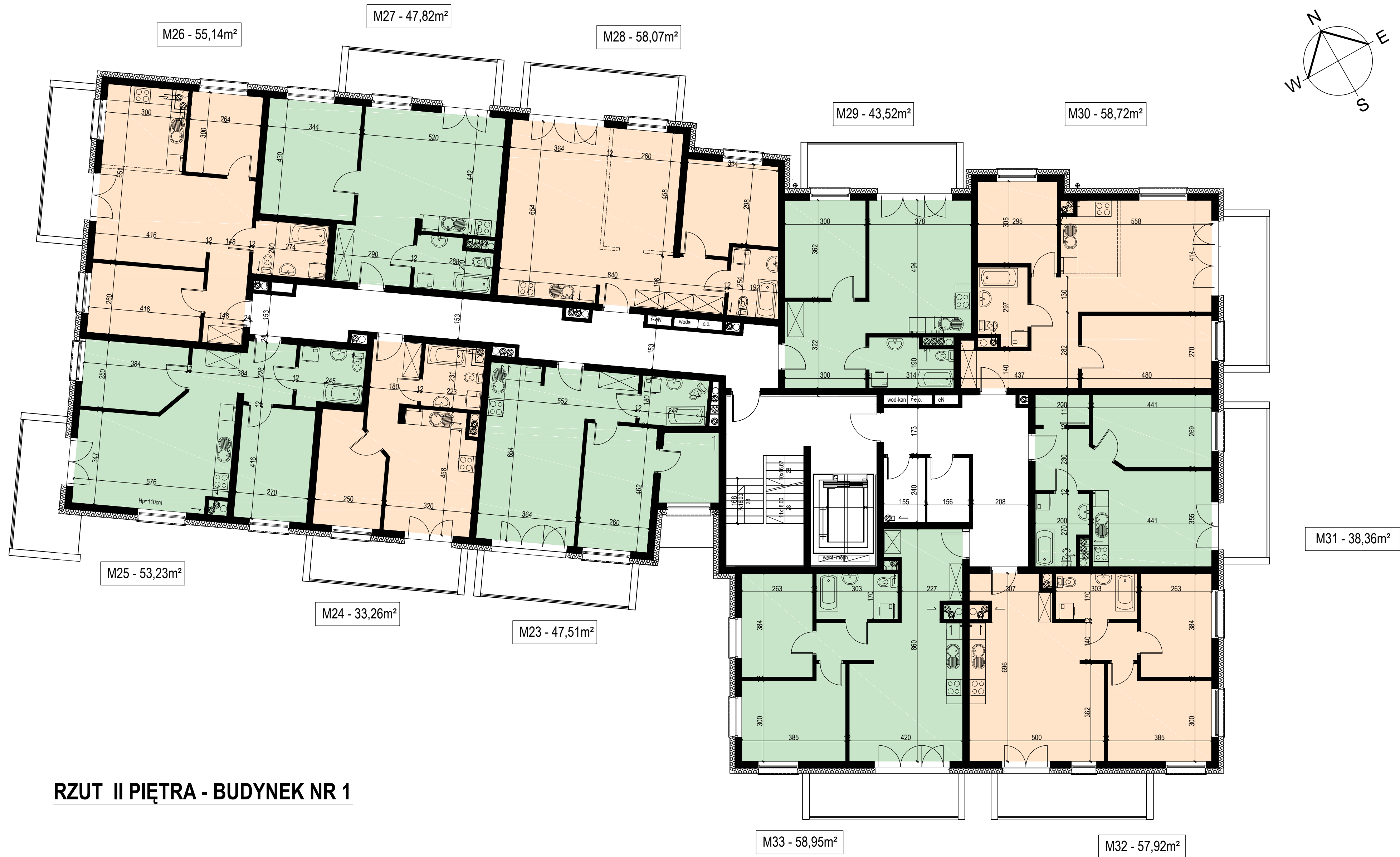
RZUT II PIĘTRA - BUDYNEK NR 1